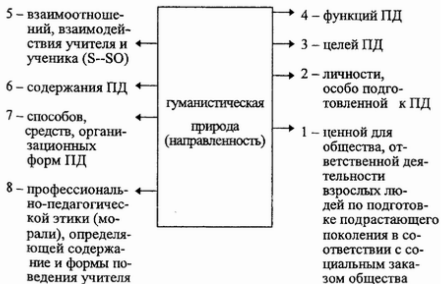
Рис. 8. Работа со схемой "Гуманистическая природа педагогической деятельности"

Определение понятия «педагогическая деятельность» в формулировке академика Б.Т. Лихачева: назначение педагогической деятельности – подготовка подрастающего поколения к жизни в соответствии с социальным заказом общества с помощью взрослых людей. Эта деятельность очень ответственна, имеет большую ценность для общества, т.к. от нее зависит судьба и жизнь каждого человека (вспомнить первый совет В.А. Сухомлинского из книги «Сто советов учителю»).